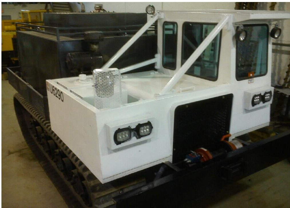
MOROOKA MST 800